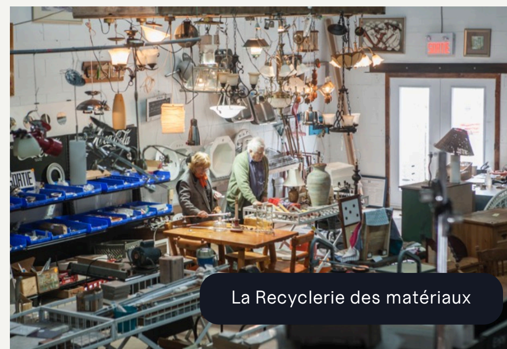
La Recyclerie des matériaux