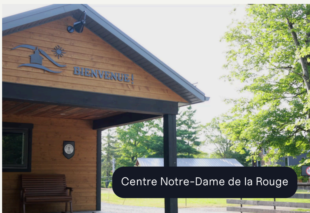
Centre Notre-Dame de la Rouge