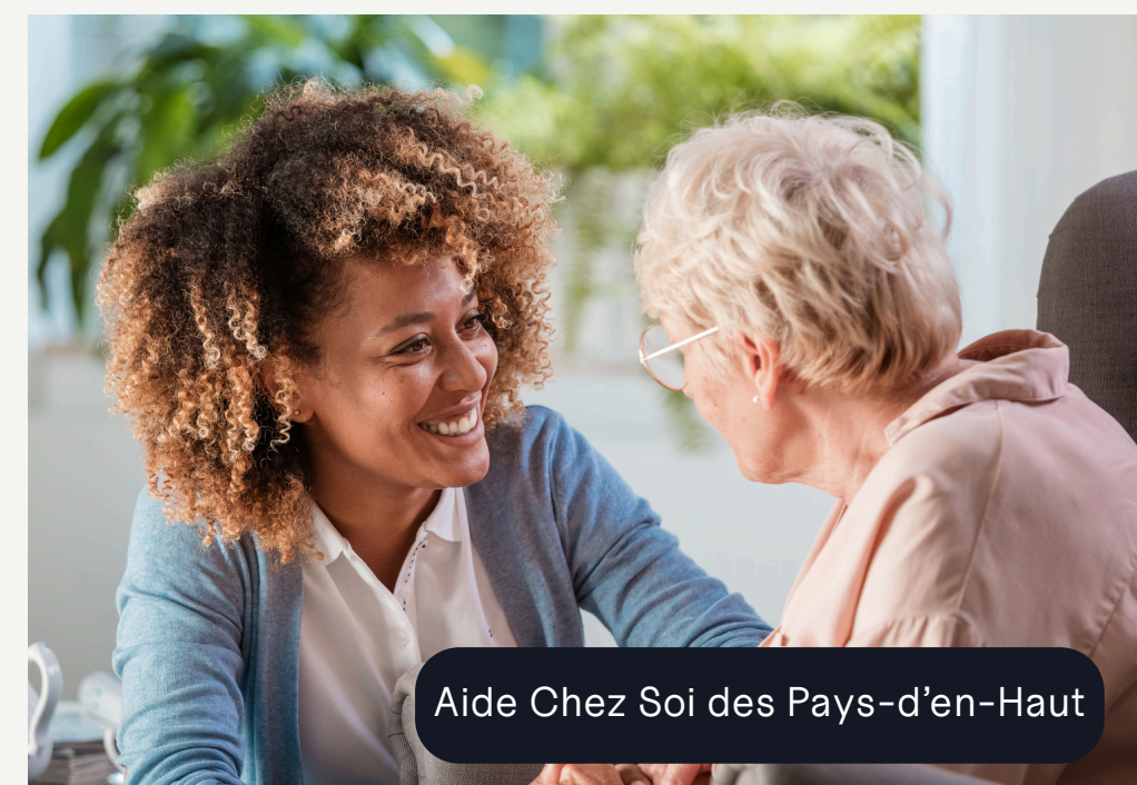
Aide Chez Soi des Pays-d'en-Haut

Cette coopérative offre à 75 personnes des logements abordables et de qualité dans un milieu de vie favorisant l'entraide et le vivre-ensemble.