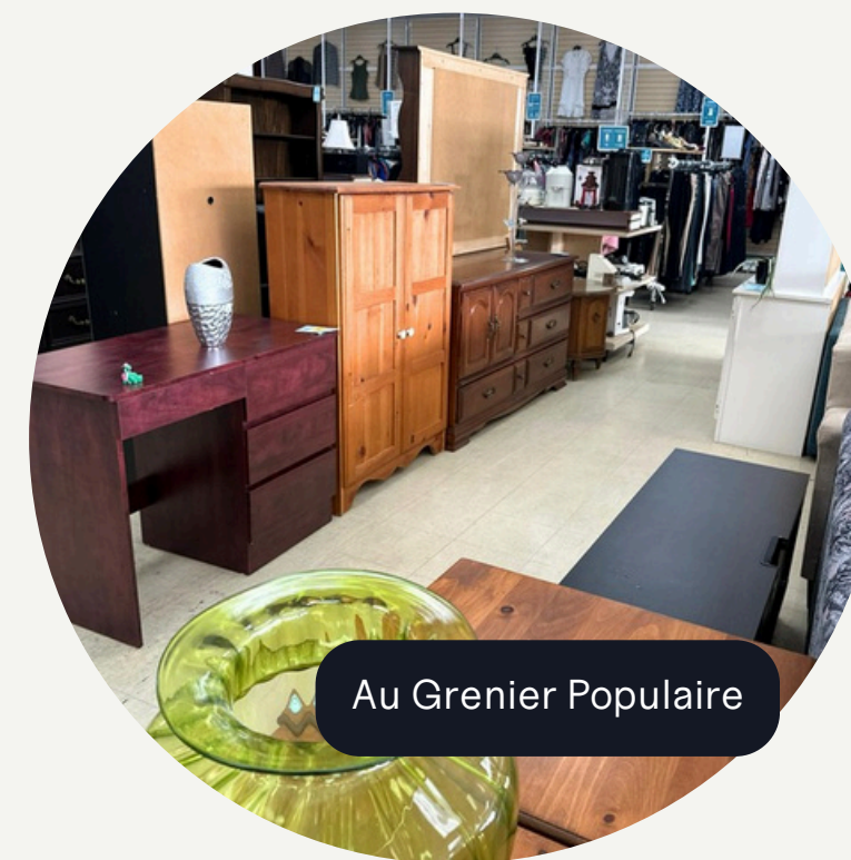
Au Grenier Populaire

des entreprises d'économie sociale des Laurentides ont plus de 10 ans d'existence.**