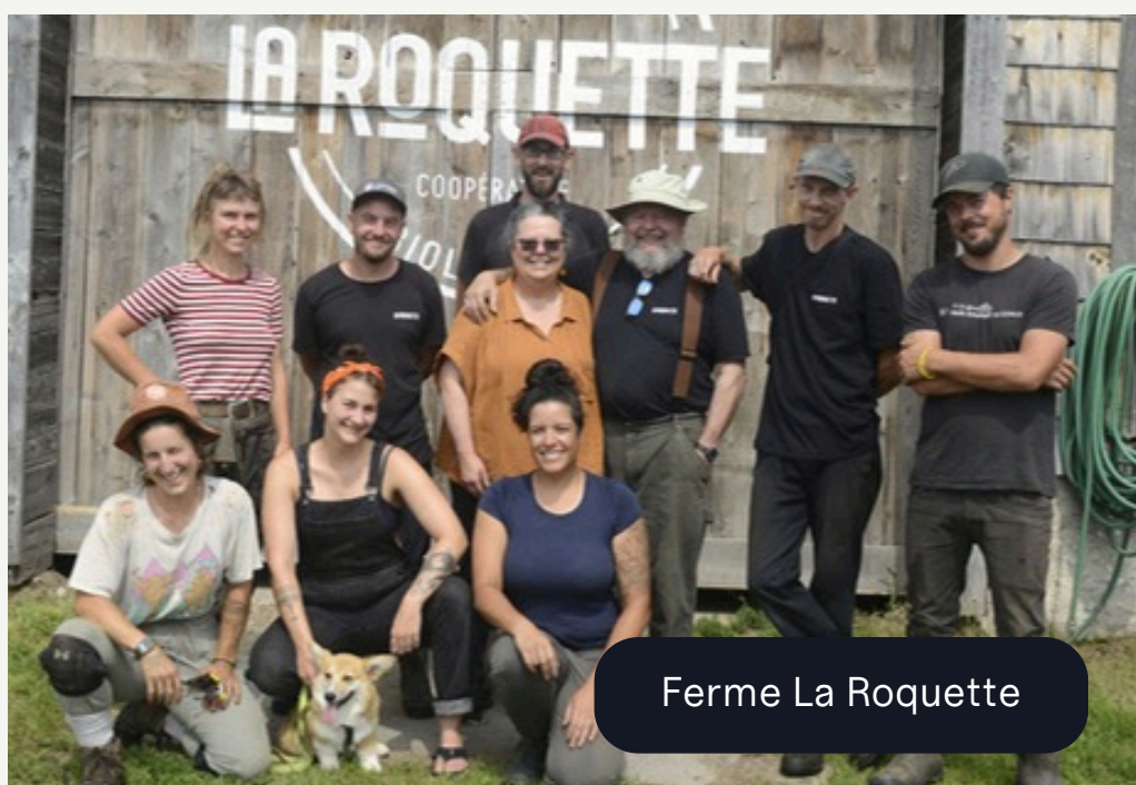
Ferme La Roquette