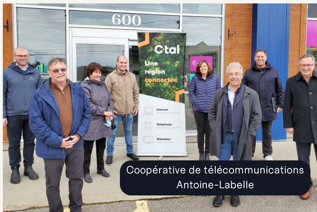
Coopérative de télécommunications Antoine-Labelle

de revenus sont générés par les entreprises d'économie sociale au Québec**. C'est près de 14 % du PIB de la province.