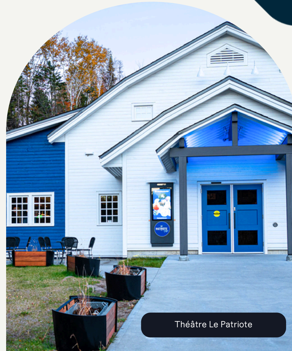
Théâtre Le Patriote