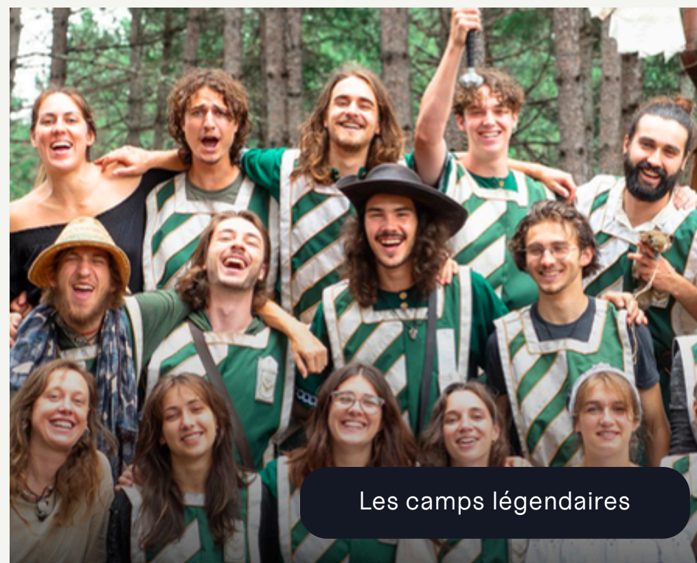
Les camps légendaires

Les OBNL et les coops occupent le premier rang de l' Indice de bonheur Léger au travail *.