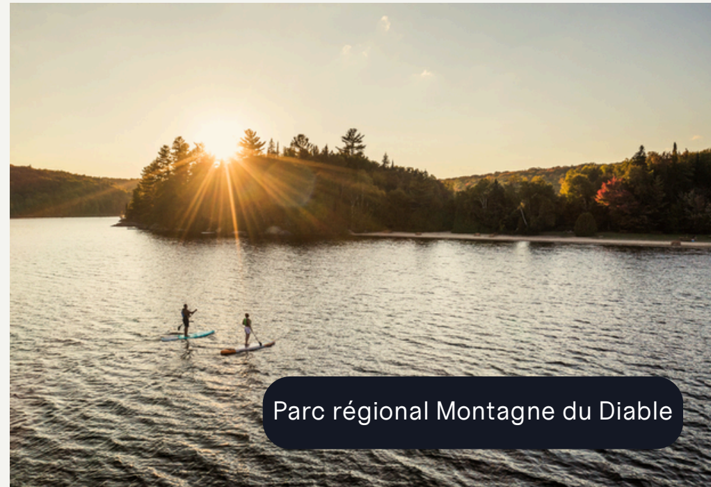
Parc régional Montagne du Diable